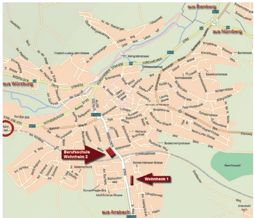
Stadtplan Neustadt a. d. Aisch